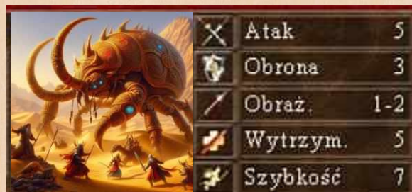
Żuk Bojowy umiejętność latania odporny na oślepienie