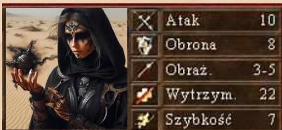
Przeklęta Szamanka odporność na czary umysłu rzuca klątwę strzelając