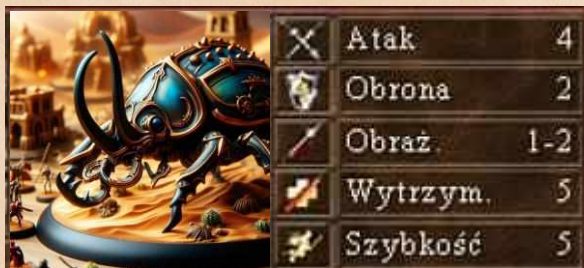
Żuk Pustyni umiejętność latania