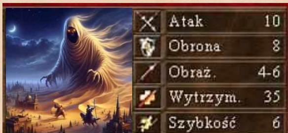
Mroczny Cięż jednostka nieożywiona umiejętność latania