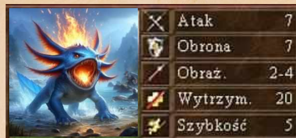
Ognisty Jaszczur odporność na spowolnienie