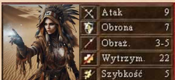
Szamanka brak dodatkowych umiejętności