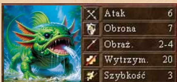
Wodny Jaszczur brak dodatkowych umiejętności