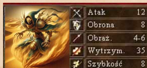
Mirażowe Widmo jednostka nieożywiona umiejętność latania powstrzymuje kontratak