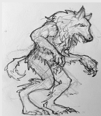
Poziom 6 - Volkolak Siedlisko: Jama pod Konarami

Prerażający potwór, w którego oczach widać jedynie żądzę mordu. Jego nadludzka szybkość i wytrzymałość pozwala na przeprowadzanie zabójczych szarż.