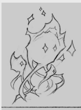
Poziom 1 - Ognik Siedlisko: Kamienny Ołtarz

Otoczająca Świąty Gaj puszcza to miejsce, gdzie dzikie siły przyrody ukazują swoją prawdziwą potęgę. Zamieszkują ją nieokiełznane potwory i straszliwe upiory, będące ucieleśnieniem mocy, magii i chaosu natury.