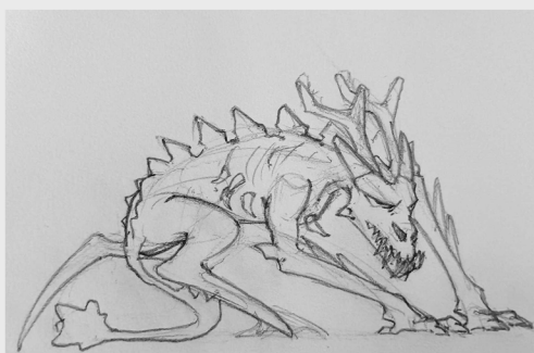
Poziom 5 - Bukavac Siedlisko: Upiorna Jaskinia

Wiedźma parająca się zabójczymi czarami i alchemią. Korzystając z tajemniczej magii lasu potrafi wywołać losowe negatywne efekty u wrogów.