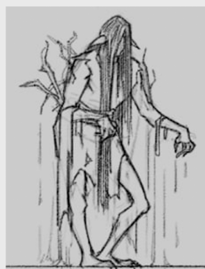
Poziom 2 - Topielec Siedlisko: Grząskie Bagno

Duszek opiekujący się lasem. Jest ucieleśnioną małą porcją magii pochodzącej od wielkiego drzewa. Potrafi przenikać przez przeszkody i leczyć wszystkie żyjące stworzenia.