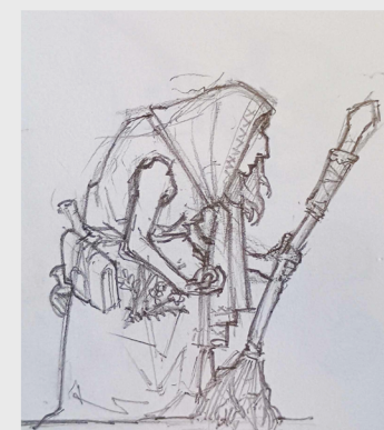
Poziom 4 - Baba Jaga Siedlisko: Chata na Kurzej Stopce

Demoniczny upiór kobiety polujący na zbłąkanych w lesie podróżnych. Duch pragnie podzielić swój nieszczęsny los z wrogami. Każdy atakujący go oddział zostaje obarczony Klątwą.