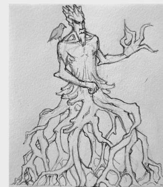
Poziom 7 - Leszy Siedlisko: Drzewne Serce

Wilczy król puszczy. Istota łączy w sobie ludzką inteligencję oraz zwierzęcą zwinność i siłę. Posiada zdolność regeneracji, jak również zwiększa swój Atak po każdym wprowadzonym ciosie.