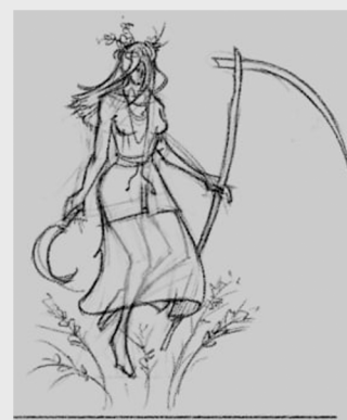
Poziom 3 - Południca Siedlisko: Zrujnowana farma

Zagubione w wodzie ciało, owdnięte przez niespokojnego ducha zmarłego. Jego jedyną wolą jest manifestacja swojego gniewu i wciąganie niesostrożnych istot do swojego siedliska.